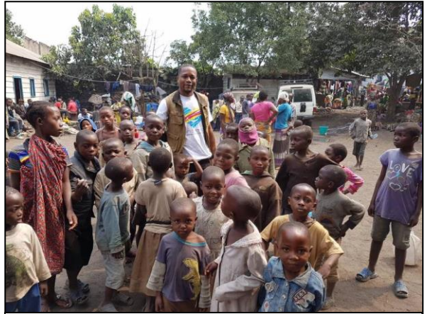
L'un des missionnaires à Bulengo au coeur d'un centre de réfugiés à Goma.

Nous voulons continuer à porter cette œuvre en particulier dans la prière car nous croyons que seul Jésus peut changer des vies. Merci à tous ceux qui ont participé à cette intervention en RDC.