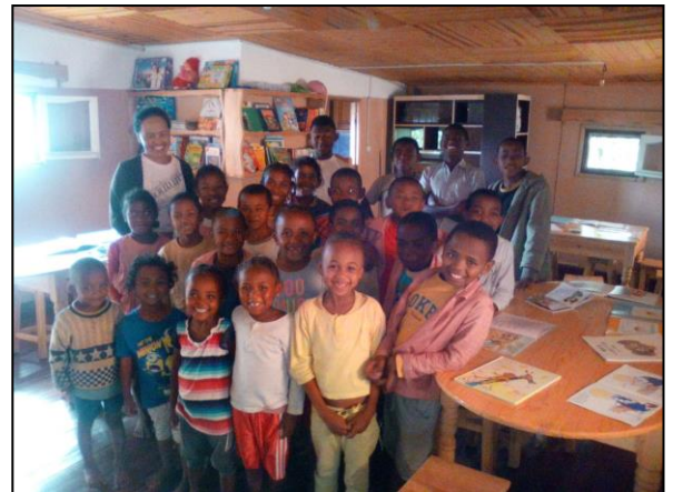
Nos enfants à Madagascar

La difficulté que la structure rencontre actuellement concerne l'éducation de certains enfants à leur hygiène corporelle et à la propreté. Dans ce domaine, la structure a toujours veillé à leur enseigner la propreté, en leur distribuant du savon pour leur douche et pour leur lessive chaque semaine mais beaucoup restent sans douche et avec des vêtements sales. En effet, certains parents vendent les habits qu'on offre à leurs enfants et ces derniers se retrouvent avec des habits déchirés et sales. Il y a donc malheureusement un problème au niveau des parents une fois que certains enfants rentrent chez eux.