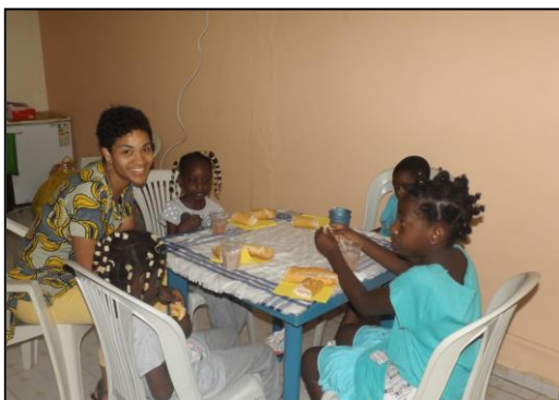
Une missionnaire avec des enfants au petit déjeuner d'accueil à la Maison d'Ecoute

La seconde structure est le Complexe Scolaire Grain de Blé, un établissement privé chrétien, composé d'un corps enseignant et administratif chrétien, dont la mission est d'instruire les enfants selon les valeurs divines prescrites par Jésus-Christ dans sa Parole. La scolarité y est actuellement payante mais à un montant inférieur aux autres écoles privées pour permettre au plus grand nombre de pouvoir bénéficier d'une éducation chrétienne. A terme, les responsables de l'école aimeraient qu'elle soit gratuite pour mieux propager l'Évangile.