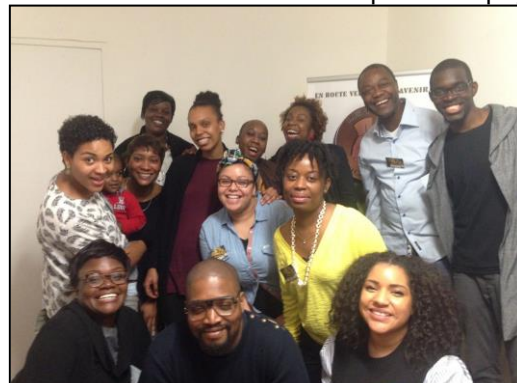
L'équipe du Pain Quotidien

Nous tenons à remercier Jésus notre Dieu et Maître pour sa Fidélité. Merci aussi à vous tous qui nous soutenez et qui avez participé à la réussite de cet événement qui s'annonce être le premier d'une belle série.