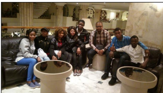
Nos étudiants et l'un de nos missionnaires

C'est avec étonnement mais beaucoup de joie que nos jeunes étudiants à Sousse ont vu arriver dans leur Université, deux missionnaires du Pain Quotidien qu'ils connaissent bien. Voici le témoignage de l'un d'entre eux lorsqu'ils leur ont rendu visite au mois de Février dernier :