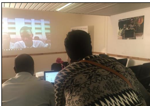
Une discussion en direct entre une marraine et son filleul

Ce moment a été l'occasion de présenter notre bilan d'activité de l'année 2016 disponible actuellement sur notre site internet. Nous avons pu échanger sur le travail du Pain Quotidien concernant l'enfant démuné ou orphelin et un temps de questions-réponses a été possible pour apporter un éclairage sur ce que nous faisons et comment nous le mettons en œuvre.