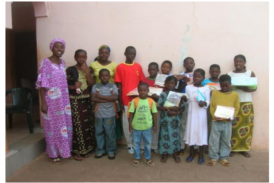
Les enfants de l'école au Mali

Les enfants ont de 3 à 14 ans et 59 d'entre eux sont pris en charge par l'école (scolarité et fournitures scolaires). Pendant l'année scolaire, nous avons des temps d'enseignement Biblique [...] nous faisons des quartiers libres (d'évangélisation, avec des jeux plein air). Nous accueillons aussi les mères célibataires qui ont décidé de garder leur bébé et les aidons à en prendre soin. »