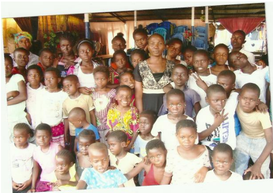
« Maman » Bibi et les enfants