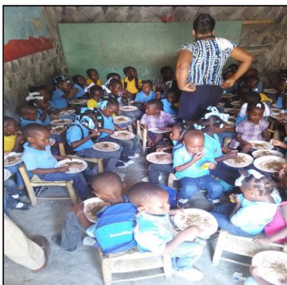
Un repas à la cantine de l'école

Au niveau scolaire, en Février ils ont passé les interrogatoires généraux, les résultats sont mitigés (malheureusement il y a eu quelques échecs). Certains ont des encouragements du directeur des études, dont un spécialement pour son examen d'état qu'il passera dans 2 mois (équivalent du bac).