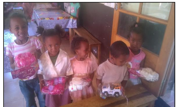
Les enfants recevant leurs jouets

Tout se passe bien à la structure : les enfants grandissent et s'épanouissent à la Maison de la Grâce. Depuis l'insertion de certains enfants en école privée, leurs résultats se sont nettement améliorés. Ces derniers mois, et en partie grâce à vos dons, les enfants ont pu acquérir de nouveaux jeux certains individuels et d'autres collectifs, ainsi que de nouvelles chaussures.