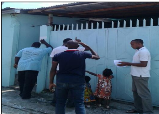
L'entrée de la maison qui accueillera prochainement les enfants